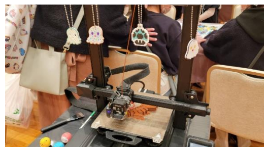
協力：東洋レジン(株)