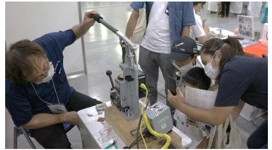
協力：(株)エムアイモデル